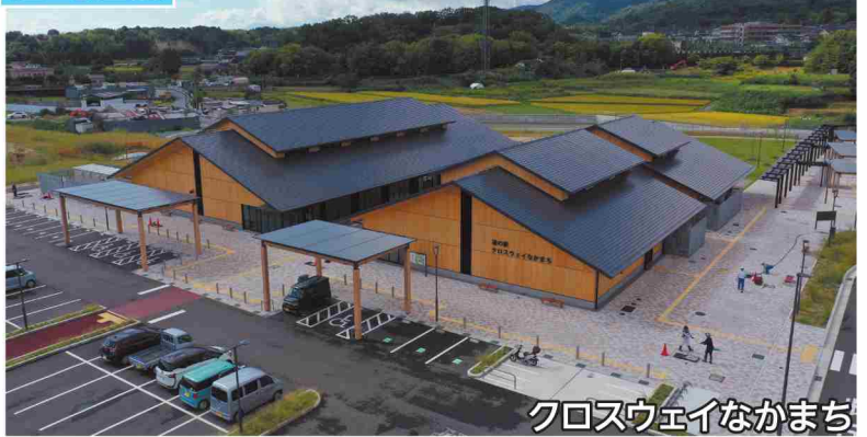
クロスウェイなかまち